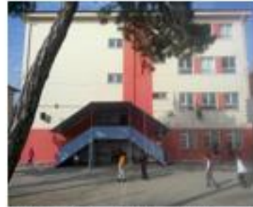
İkinci Bina Arkadan Görünüş

Bu bina 12 derslikli olup İzzet Baysal Anaokuluna aittir fakat üç katı okulumuza tahsis edilmiştir. Bu binadaki bir derslik de Sakarya İlkokulu tarafından kullanılmaktadır.