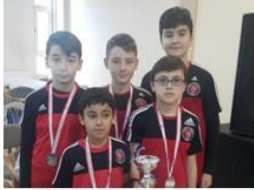
Satranç küçük erkekler takımımız il ikincisi oldu. Fayın: 18.02.2018