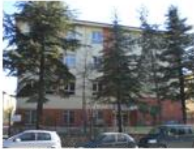
İkinci Bina Ondan Görünüş

Bu bina 12 derslikli olup İzzet Baysal Anaokuluna aittir fakat üç katı okulumuza tahsis edilmiştir. Bu binadaki bir derslik de Sakarya İlkokulu tarafından kullanılmaktadır.