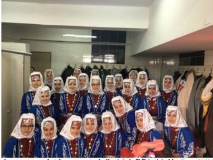
Halk oyunları yarışmasında takımımız ortaokullar içinde İl İkincisi oldu. Yayın: 06.02.2018