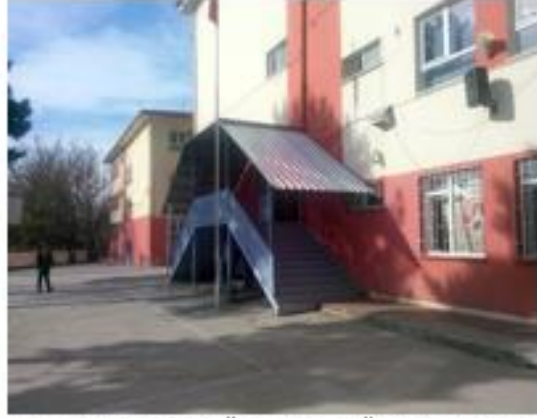
İkinci binamıza giriş için yapılmış olan merdivenler 2015-2016 Eğitim ve Öğretim Yılı'nda genişletilmiştir.