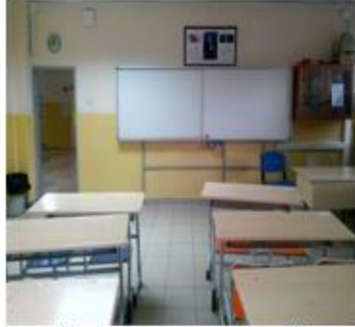
Sınıflarımızda etkileşimli tahtalar 2015-2016 Eğitim ve Öğretim Yılı başından beri öğretmen ve öğrencilerimiz tarafından aktif olarak kullanılmaktadır.