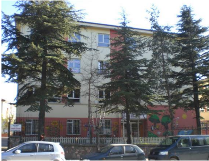
İkinci Bina Önden Görünüş

Bu bina 12 derslikli olup İzzet Baysal Anaokulu'na aittir fakat üç katı okulumuza tahsis edilmiştir. Bu binadaki bir derslik de Sakarya İlkokulu tarafından kullanılmaktadır.