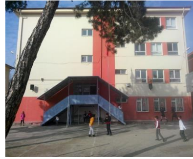
İkinci Bina Arkadan Görünüş

Bu bina 12 derslikli olup İzzet Baysal Anaokulu'na aittir fakat üç katı okulumuza tahsis edilmiştir. Bu binadaki bir derslik de Sakarya İlkokulu tarafından kullanılmaktadır.